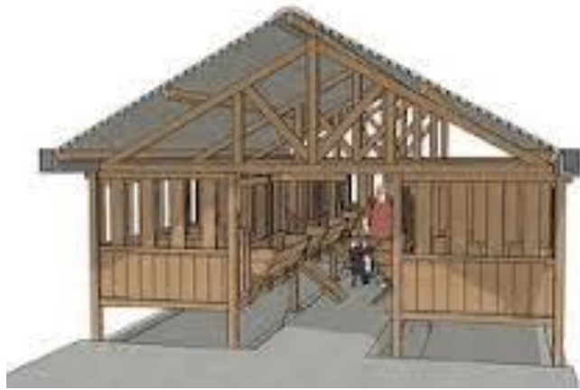
Gambar: Kandang Panggung

Kandang panggung merupakan kandang yang konstruksinya dibuat panggung atau di bawah lantai kandang terdapat kolong untuk menampung kotoran. Adanya kolong dapat menghindari kebecakan, menghindari kontak dari tanah yang mungkin tercemar penyakit, dan memungkinkan ventilasi kandang yang lebih bagus. Lantai kandang ditinggikan antara 0,5 s/d 1 meter. Dengan bahan yang sama, kandang dengan panggung yang pendek akan lebih kokoh dibandingkan dengan kandang berpanggung tinggi.