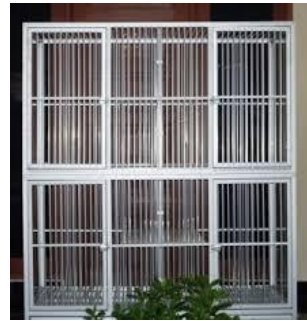
Gambar Kandang dari tembok yang disekat-sekat