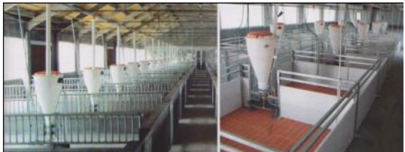
Gambar: Kandang Koloni/kelompok

Kandang koloni merupakan kandang yang tidak memiliki penyekat, walaupun disekat, ukuran kandang relatif luas. Untuk memelihara beberapa babi sekaligus. Luas kandang disesuaikan dengan umur bakalan dan jumlah ternak yang dipelihara.