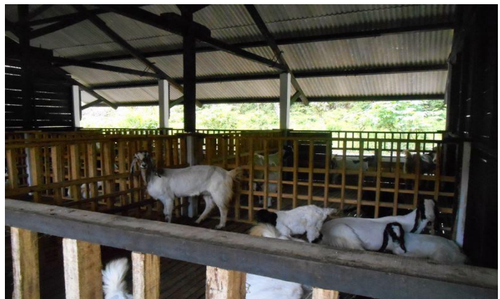
Gambar: Kandang Koloni/kelompok

Kandang koloni merupakan kandang yang tidak memiliki penyekat, walaupun disekat, ukuran kandang relatif luas untuk memelihara beberapa ekor kambing/domba sekaligus. Luas kandang disesuaikan dengan umur bakalan dan jumlah ternak yang dipelihara. Secara umum luasan yang dibutuhkan per ekor kambing/domba adalah 1 s/d 1,5 m 2 /ekor.