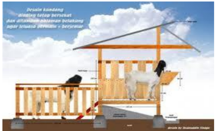
Gambar: Kandang individual