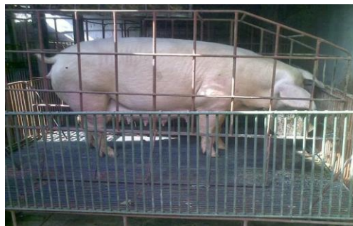
Gambar: Kandang individual

Kandang indivual merupakan kandang yang disekat-sekat sehingga tiap sekat akan berisi satu ekor ternak babi.