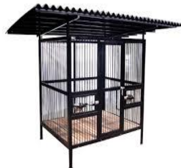
Gambar Kandang individu yang beratap dari logam