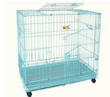
Gambar Kandang tipe cage